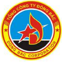
DONG BAC CORPRATION